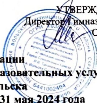
График реализации платных дополнительных образовательных услуг, Гимназии г. Вольска с 04 сентября 2023 года по 31 мая 2024 года